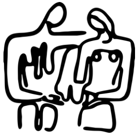
Escola Josep Dalmau Carles